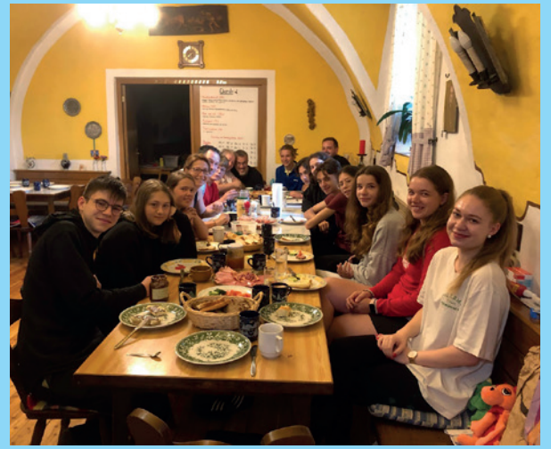
Begleiter des Jungcharlagers