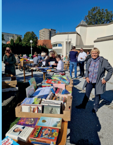
Erntedank Graz-Süd | Bücherflohmarkt