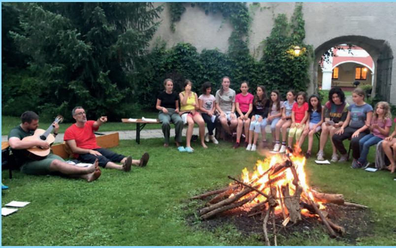
Gemeinsames Jungcharlager der Pfarren St. Peter und Liebenau-St. Paul