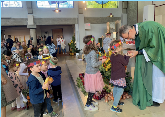
Erntedank in Liebenau-St. Paul