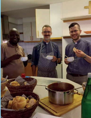
Ehrenamtsfest in Autal