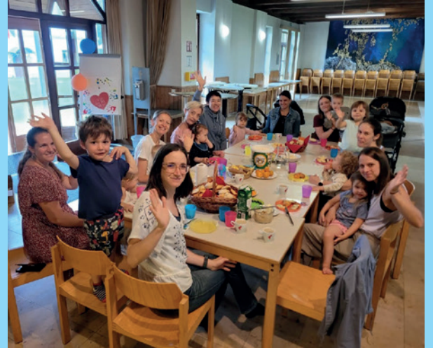
Sommerfest bei den StöpslerIn