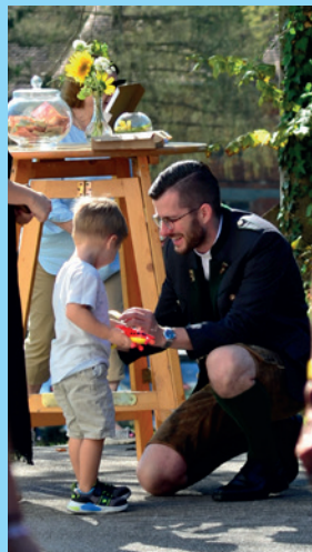
Pfarrfest in Autal