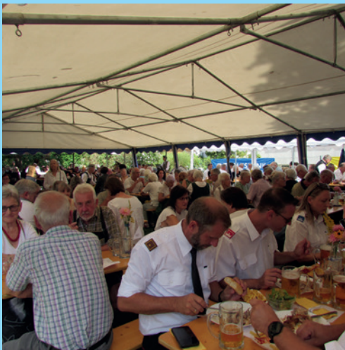
Pfarrfest in St. Christoph