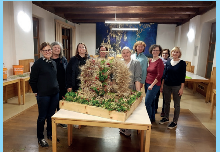
Erntedank in St. Peter